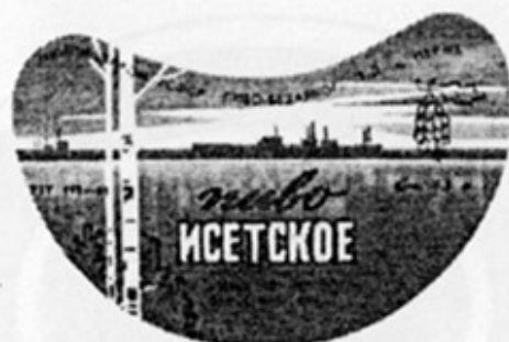
RUS - Пермь