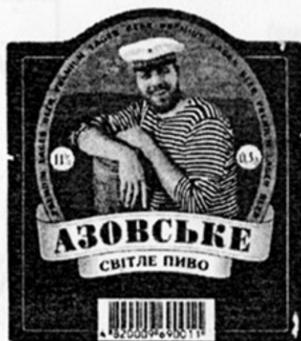
UA - Мелитополь