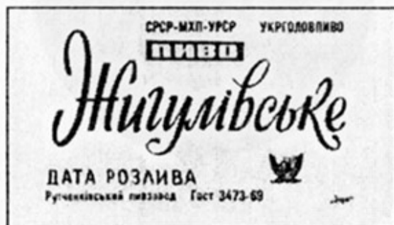
UA - Рутченки