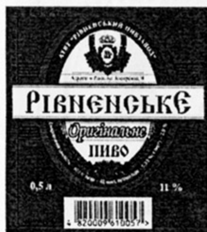
UA - Ровно