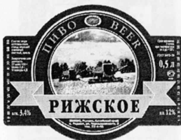
RUS - Родино, Алтайск. кр.