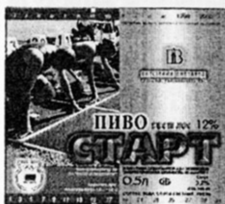
ВУ - Витебск