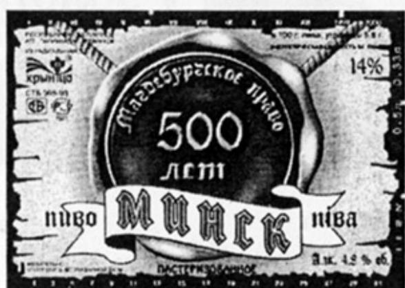
ВУ - Минск (Крыница)