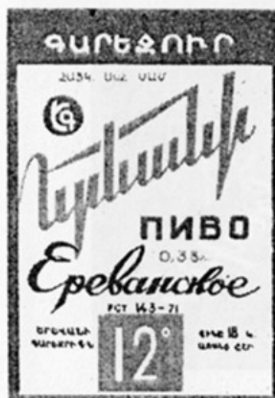
ARM - Ереван