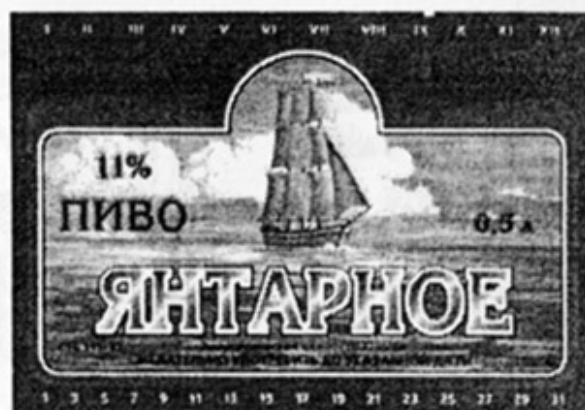
ВУ - Витебск