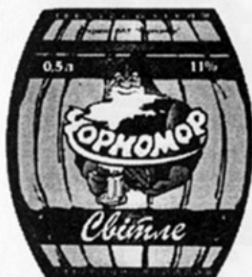
UA - Одесса (Черномор)