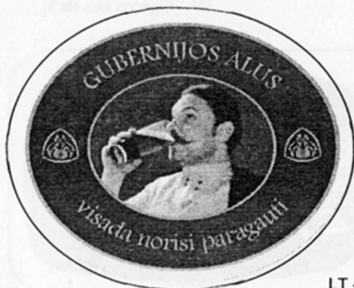
LT - Шауляй