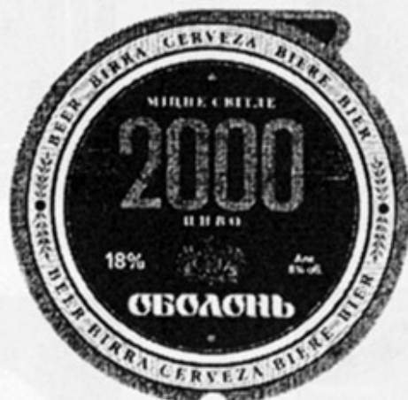
UA - Киев (Оболонь)