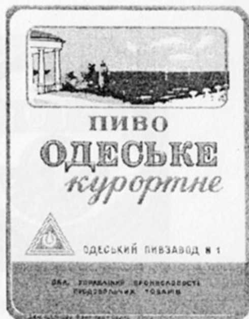
UA - Одесса (п/з № 1)