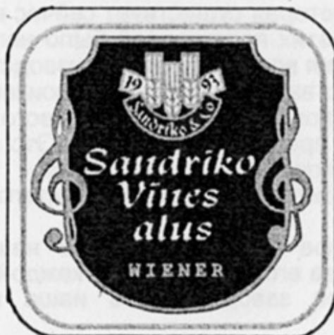
LV - Рига (Sandriko)