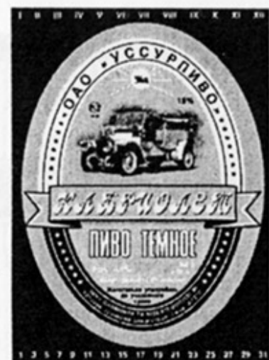
RUS - Уссурийск