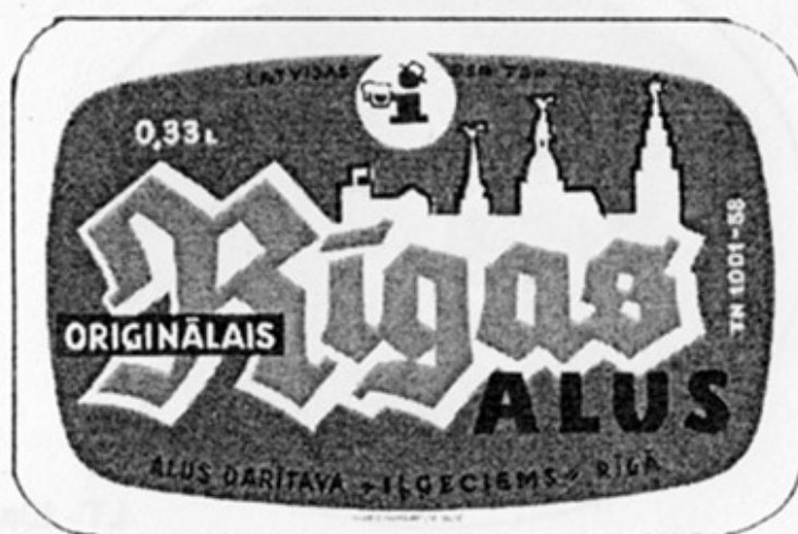
LV - Рига (Ilgeciems)