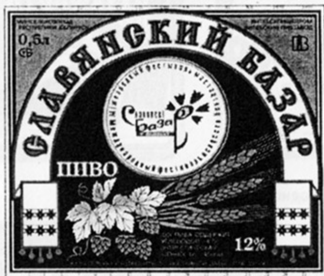
ВУ - Витебск