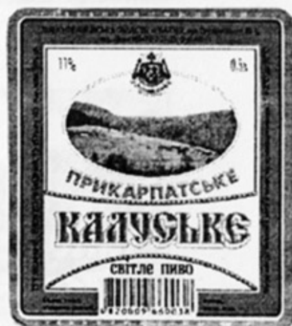
UA - Калуш