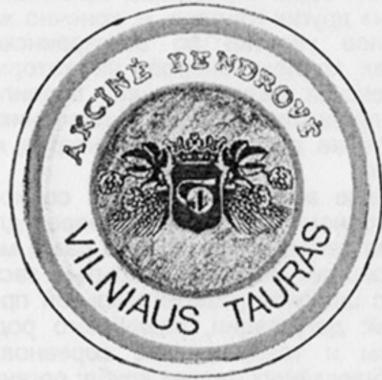
LT - Вильнюс (Tauras)