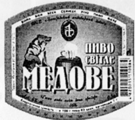
UA - Запоріжжє (п/з №1)