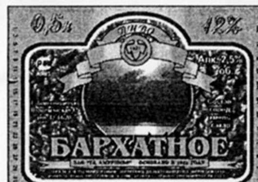
RUS - Благовещенск