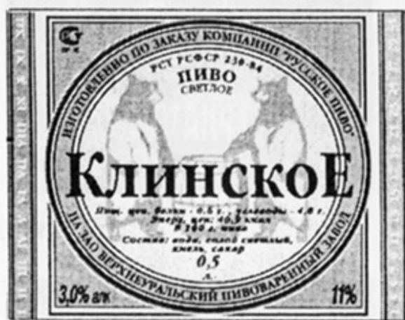
RUS - Верхнеуральск