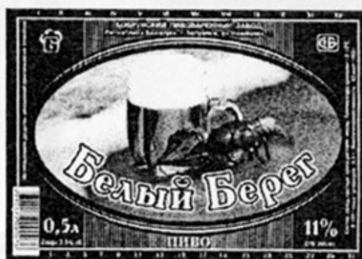
ВУ - Бобруйск