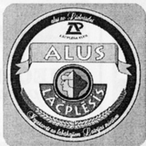
LV - Лиелварде