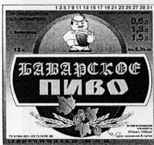
RUS - Белокуриха, Алтайск. кр.