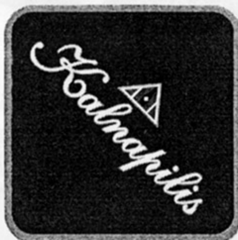
LT - Паневежис