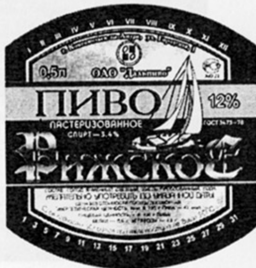
RUS - Комсомольск-на-Амуре