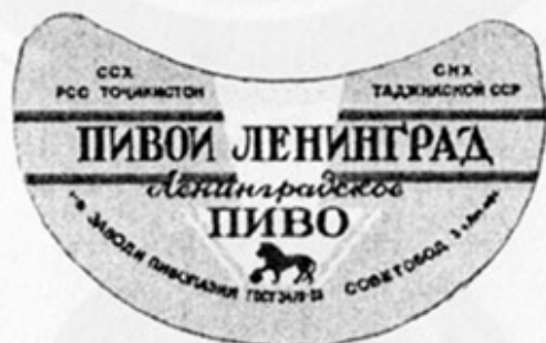
TD - Советабд