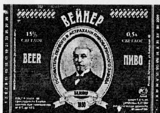
RUS - Астрахань