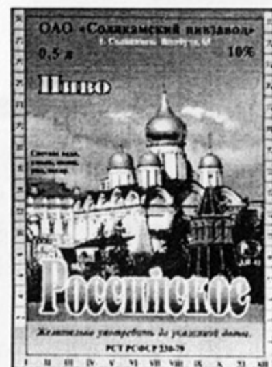
RUS - Соликамск