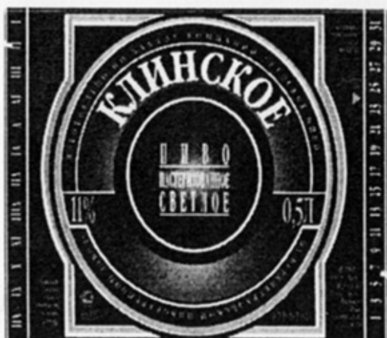
RUS - Верхнеуральск