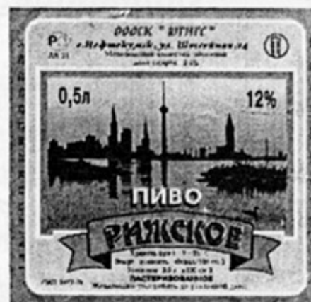
RUS - Нефтекумск