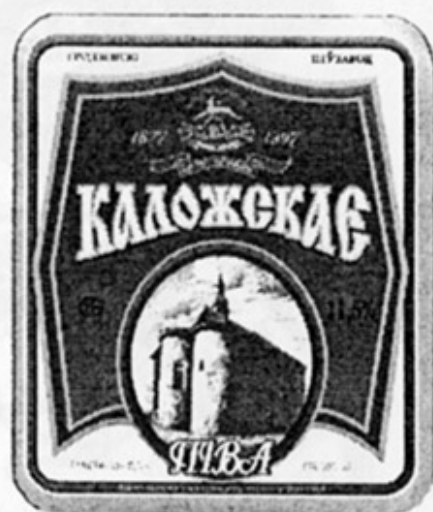
ВУ - Гродно