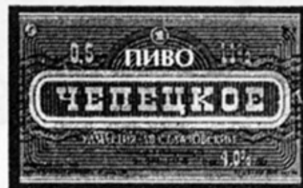
RUS - Глазов (ЛВЗ)