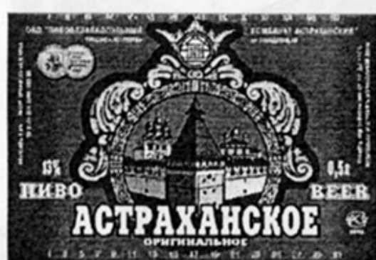
RUS - Астрахань