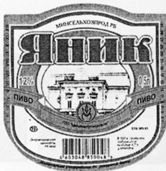
ВУ - Могилев