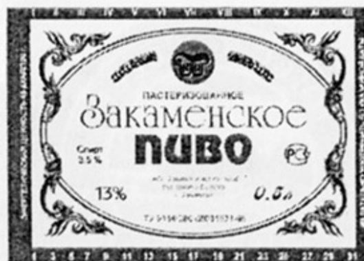
RUS - Закаменск