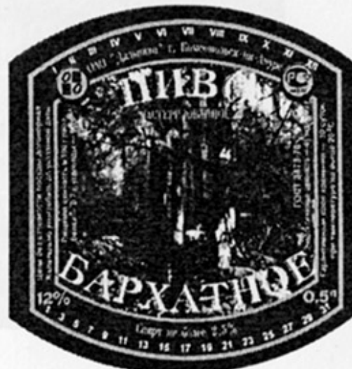
RUS - Комсомольск-на-Амуре