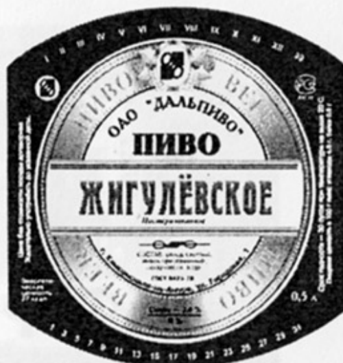
RUS - Комсомольск-на-Амуре