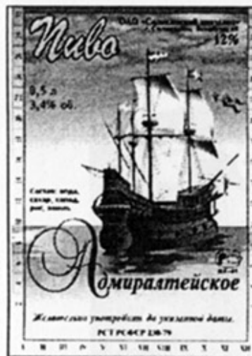
RUS - Соликамск