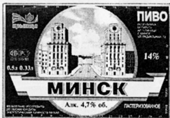
ВУ - Минск (Крыница)