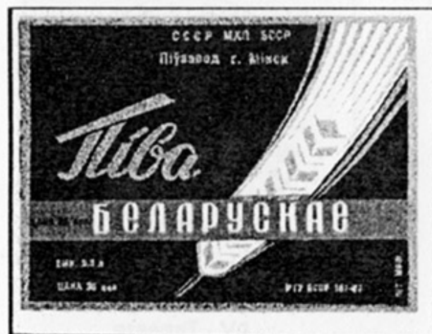
BY - Минск