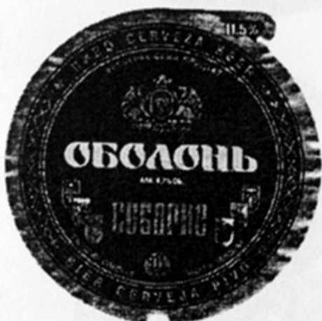
UA - Киев (Оболонь)