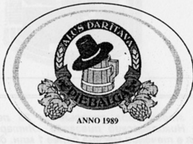
LV - Яунпибалга