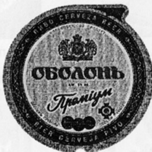
UA - Киев (Оболонь)