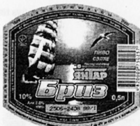
UA - Николаев