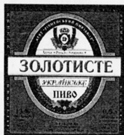
UA - Ровно