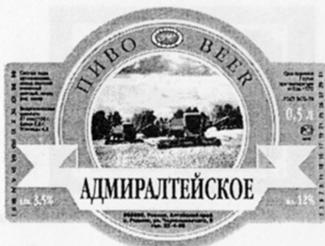
RUS - Родино, Алтайск. кр.