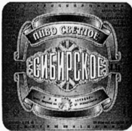
RUS - Братск