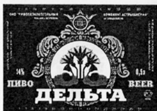
RUS - Астрахань