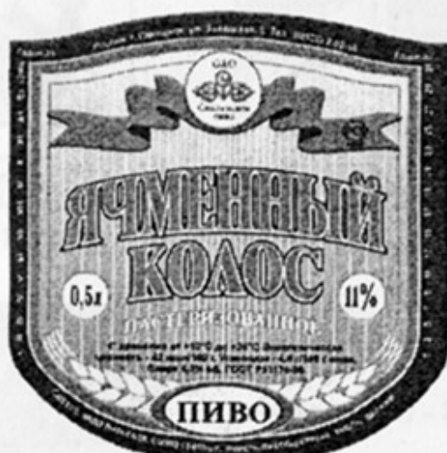
RUS - Смоленск