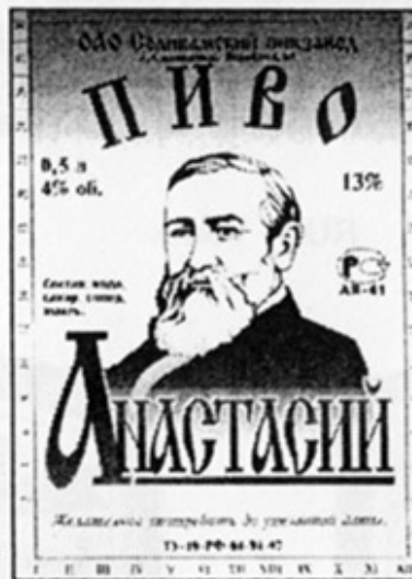
RUS - Соликамск