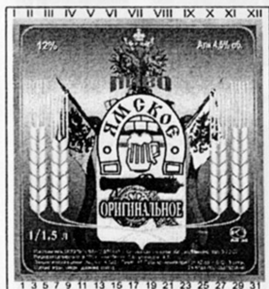
RUS - Вязьма