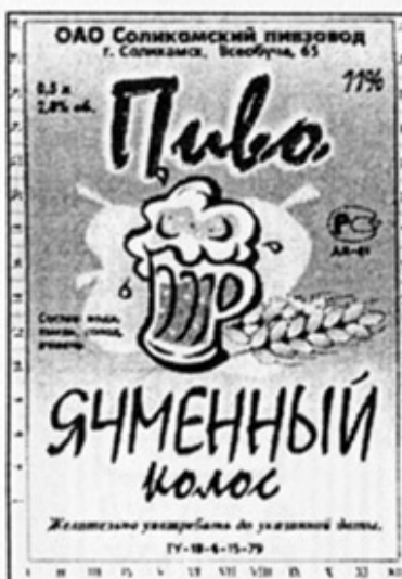
RUS - Соликамск