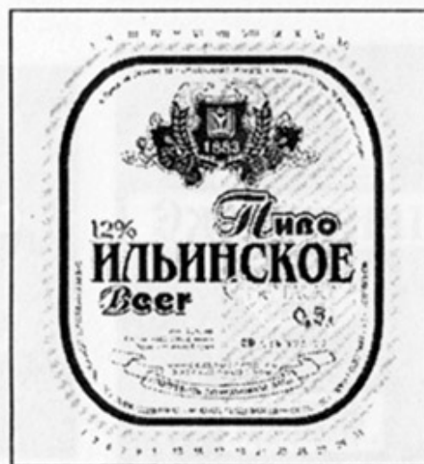
ВУ - Орша