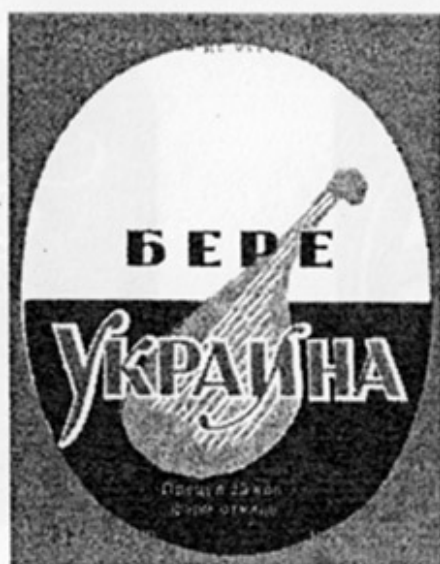
MD - Бендеры