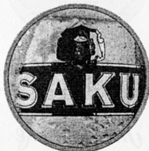
EST - Саку