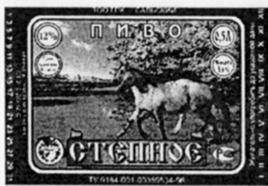
RUS - Сальск