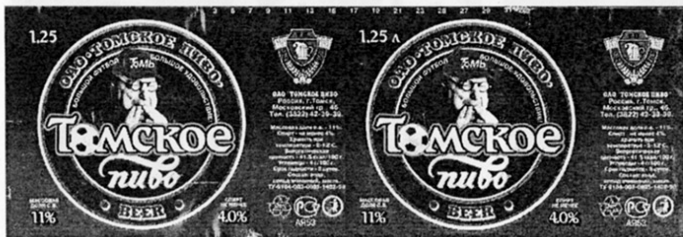
RUS - Томск