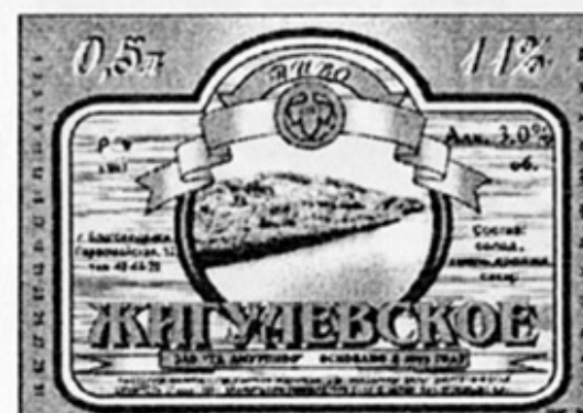
RUS - Благовещенск