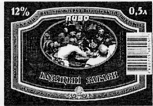
UA - Новгород-Волынский